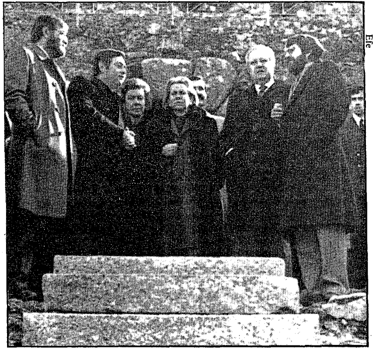
Mario Soares —segundo por la izquierda— y su esposa fueron acompañados por el presidente de la Junta de Extremadura, otras autoridades de la región y el embajador portugués en España